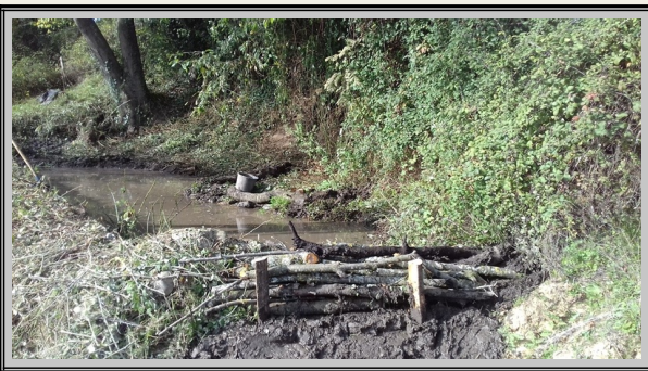
Une serve après nettoyage et curage

Pour le premier trimestre 2025, quatre nouvelles créations sont en projet, trois sur la commune de La Frette et une à Izeaux. De nouveaux bénévoles peuvent nous rejoindre pour ces chantiers.