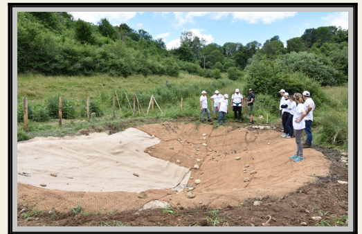
Les bénévoles de La Caisse d'Épargne sur le chantier d'une des mares